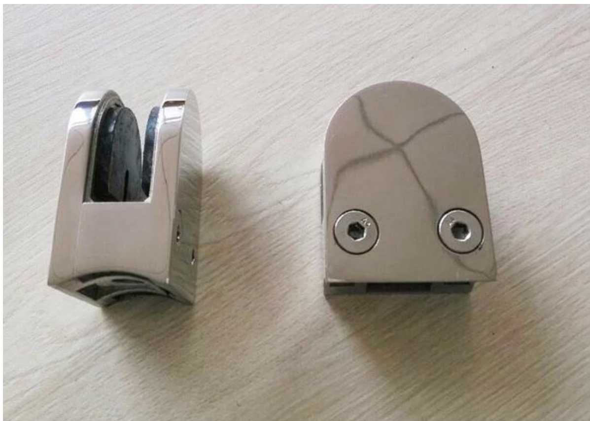
2. Круглая форма из нержавеющей стали стекла клип фотопроект,