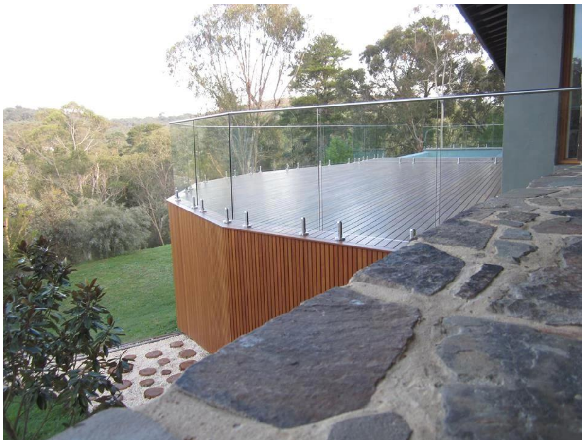
Стекло палуба забор для террасы: