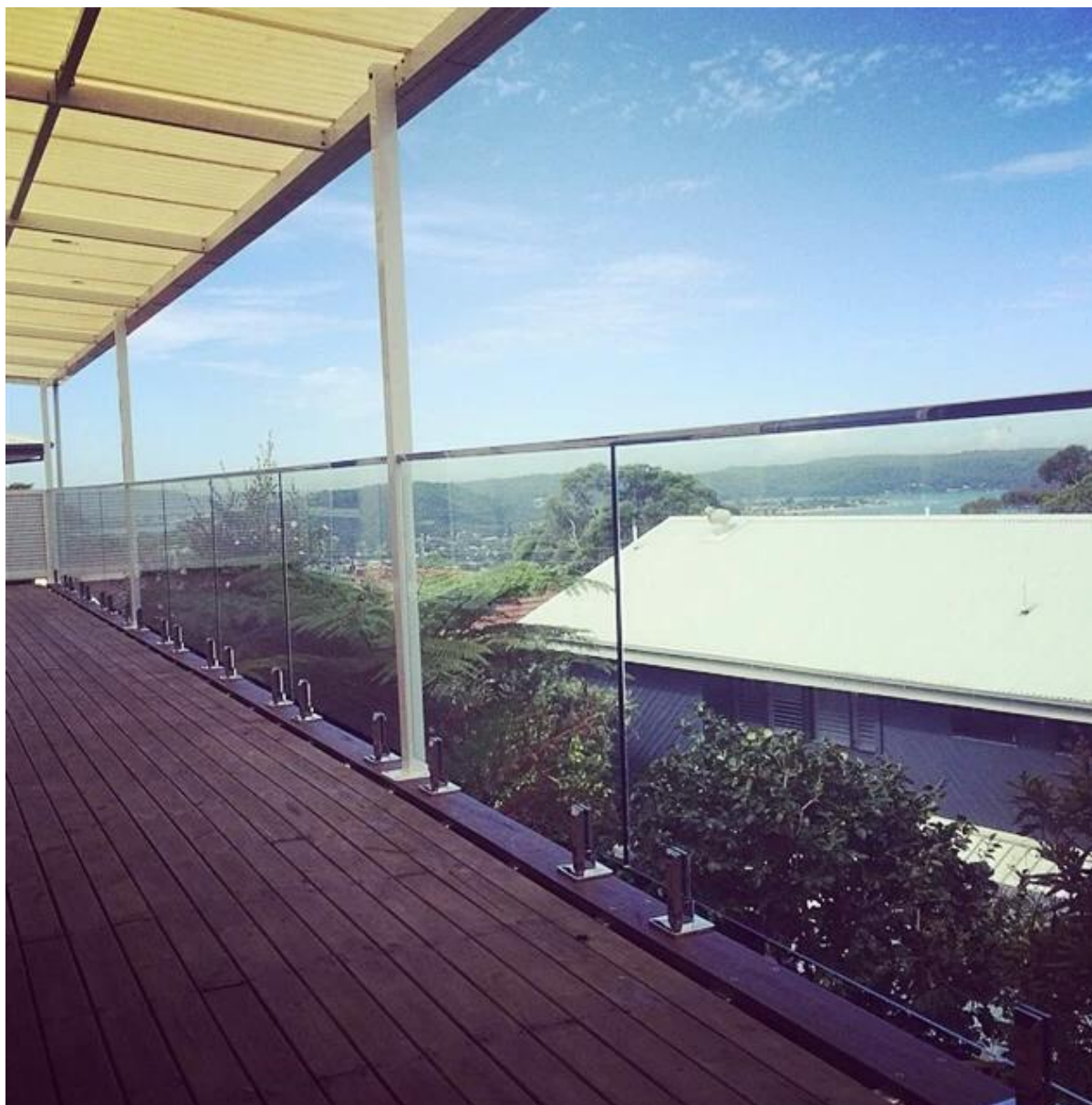
Стекло палуба забор для бассейна: