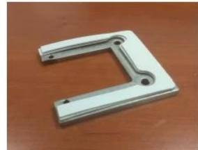
Фото упаковки петли стеклянной двери-