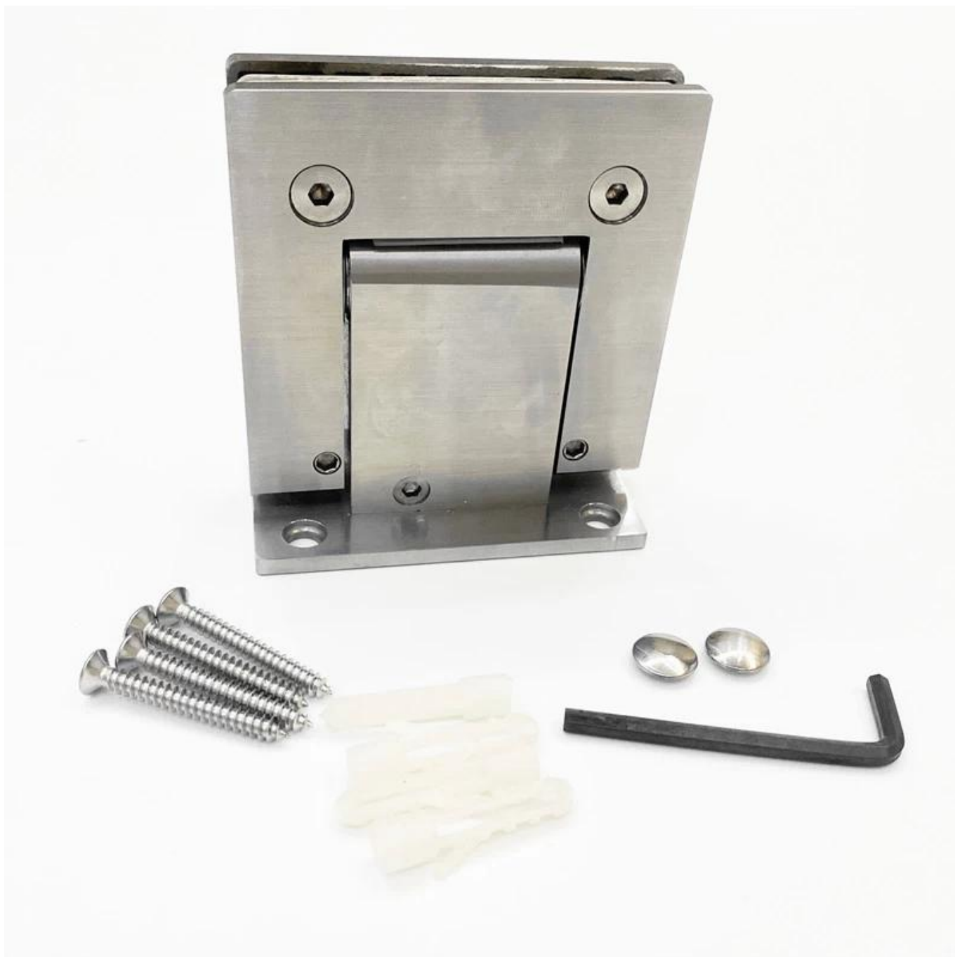
Монтажные приспособления для плавного закрывания Петли для стеклянной двери душевой кабины -