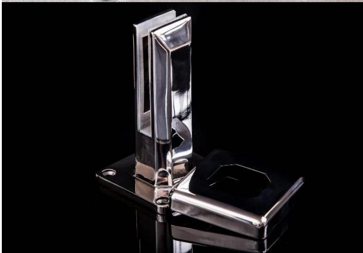
Проект на гос бассейн забор, забор балкон и палубы;