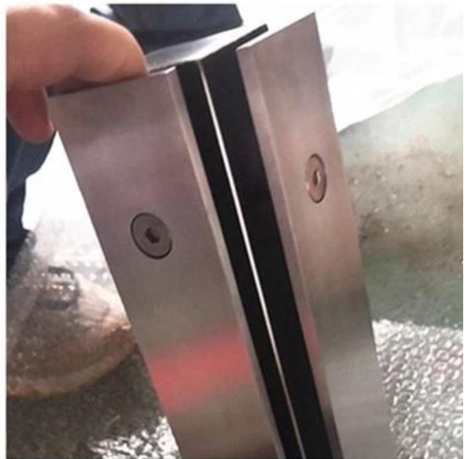
Фото проекта системы стеклянных балюстрад из нержавеющей стали для балкона -