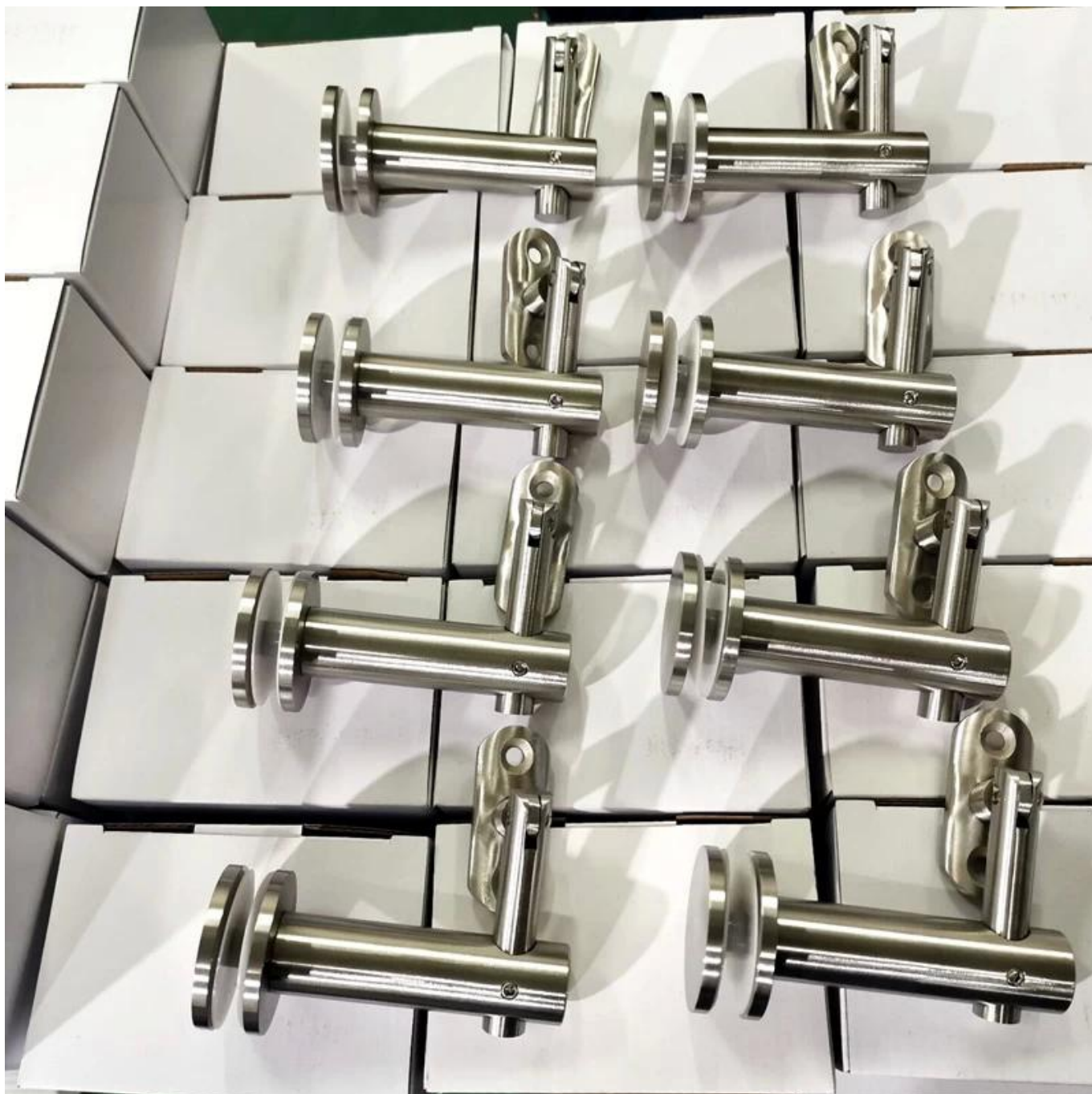
Фото проекта стеклянных перил -