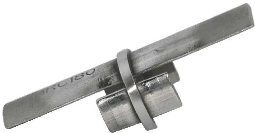
(3) стенки к разъему рельса