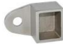
square top rail