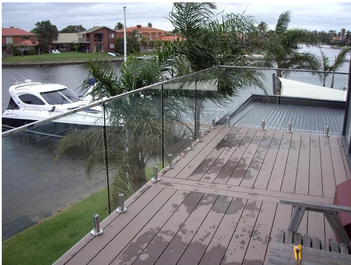
стекло втулка: RBM-2