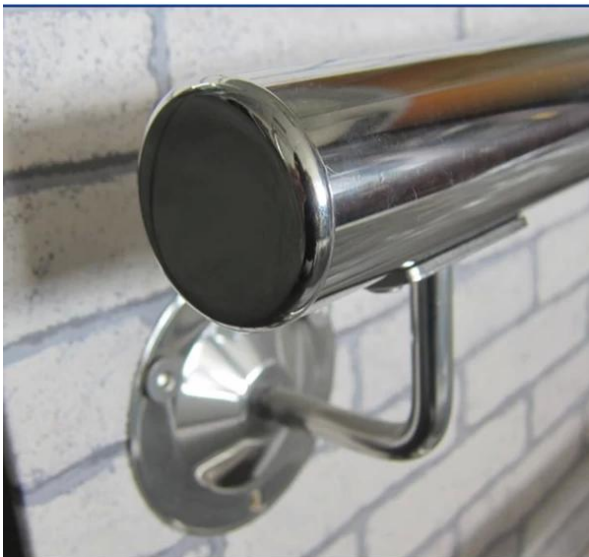
из нержавеющей стальной столб перила торцевая крышка