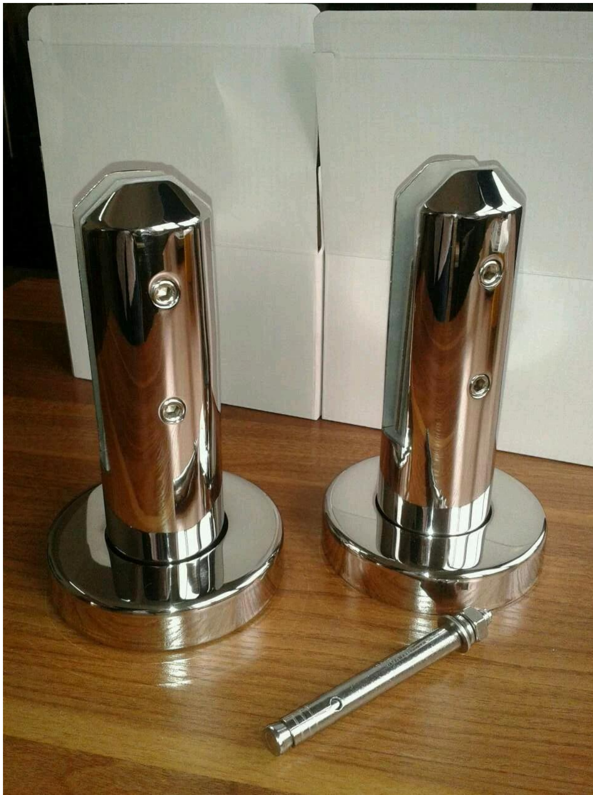
2). Круглая плита основания цапфы массовые товары Фото.