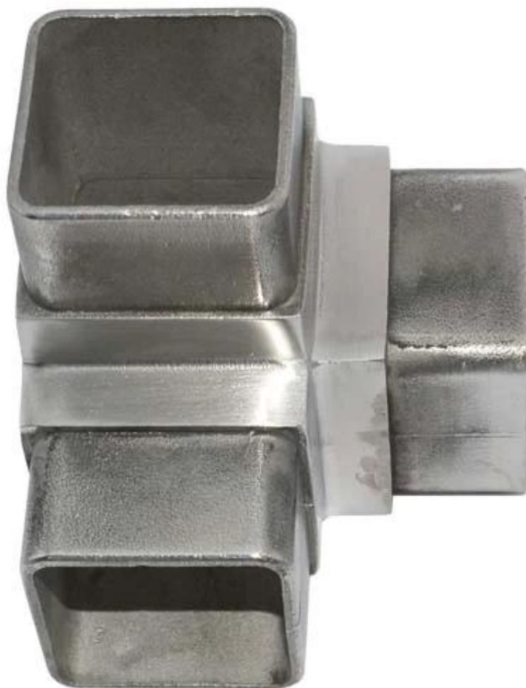
Соединитель трубы квадратного сечения 4 способа