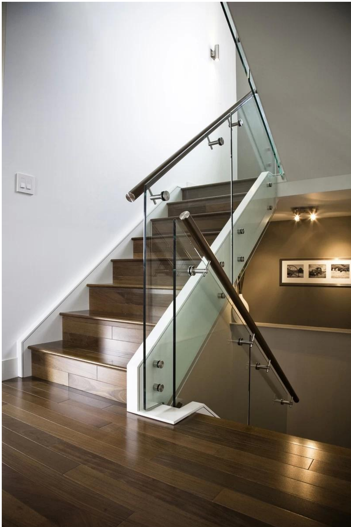
Фиксированный проект поручень кронштейны из нержавеющей стали :